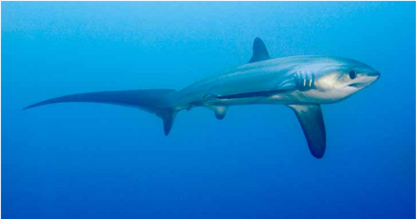
Tiburón azotador pelágico ( Alopias pelagicus ).

estables, mientras que las demás pesquerías probablemente no sean sostenibles, y concluyen que «en general, los datos son insuficientes para determinar si los niveles de disminución de estas especies cumplirían los criterios de inclusión en el Apéndice II que figuran en el Anexo 2a de la Resolución Conf. 9.24 (Rev. CoP16)», pero que «si se incluyera a alguna de las especies en el Apéndice II, las otras especies del género cumplirían los criterios del Anexo 2b (criterios de semejanza)». TRAFFIC recomienda que las Partes de CITES acepten la propuesta de inclusión de los tiburones zorro en el Apéndice II, puesto que dicha inclusión sería beneficiosa para estas especies porque constituiría una plataforma muy necesaria para la cooperación internacional en la lucha contra el comercio insostenible de estos animales; también daría lugar a una mejora en el seguimiento y la presentación de informes sobre las capturas en el comercio, lo cual mejoraría la capacidad de realizar evaluaciones del estado de los stocks y las medidas de gestión resultantes.