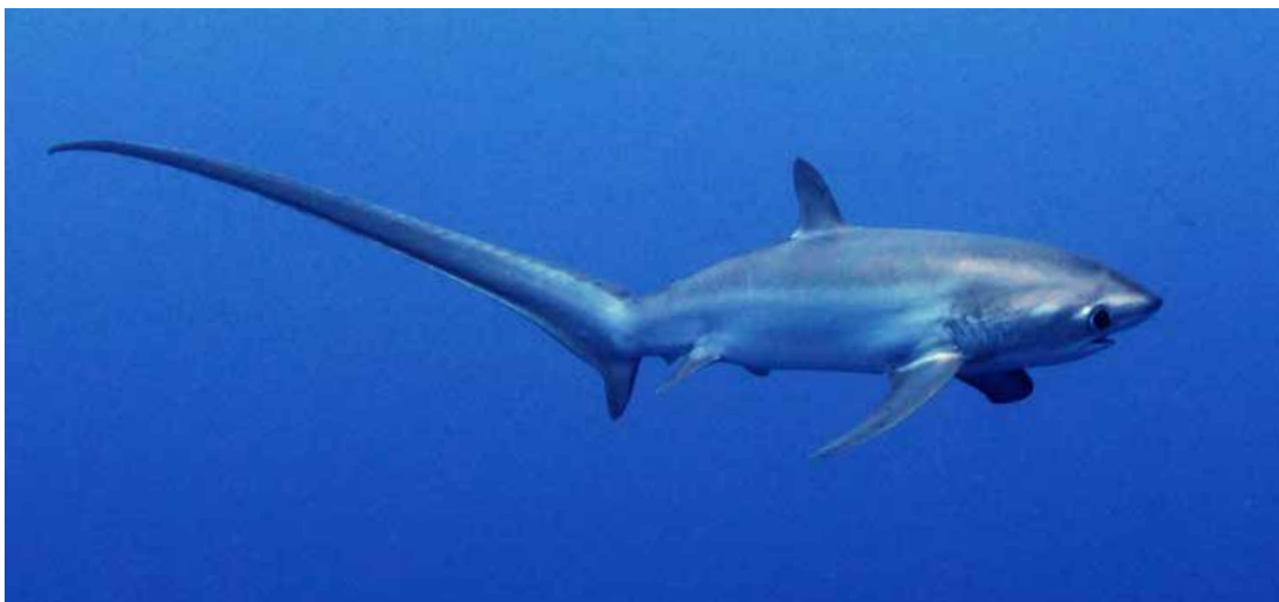
Tiburón zorro ojón ( Alopias superciliosus ).

Bahamas, Bangladesh, Benín, Brasil, Burkina Faso, las Comoras, Egipto, Fiji, Gabón, Ghana, Guinea, Guinea-Bissau, Kenia, las Maldivas, Mauritania, Palau, Panamá, República Dominicana, Samoa, Senegal, Seychelles, Sri Lanka, Ucrania y la Unión Europea.